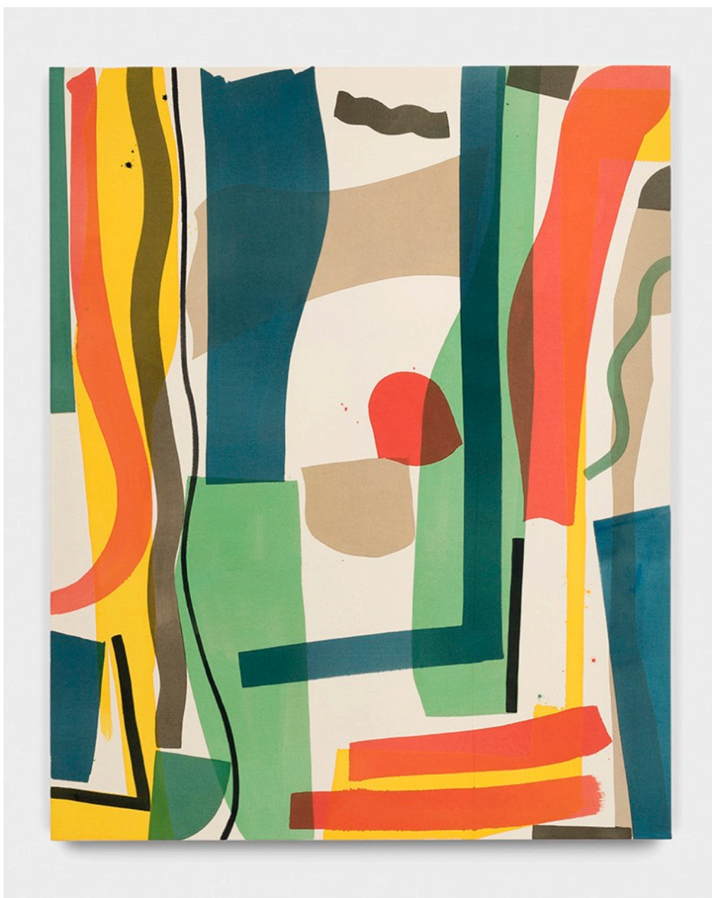
Sans titre - 2018, acrylique sur toile, 162 x 130 cm

Né en 1983 à Saint-Jean de Luz, vit et travaille à Paris