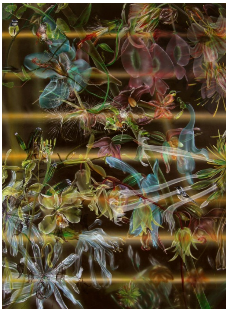
Opus Dei #4 - 2015, huile sur toile, 190 x 140 cm

Né en 1970 à Paris, vit et travaille à Bruxelles