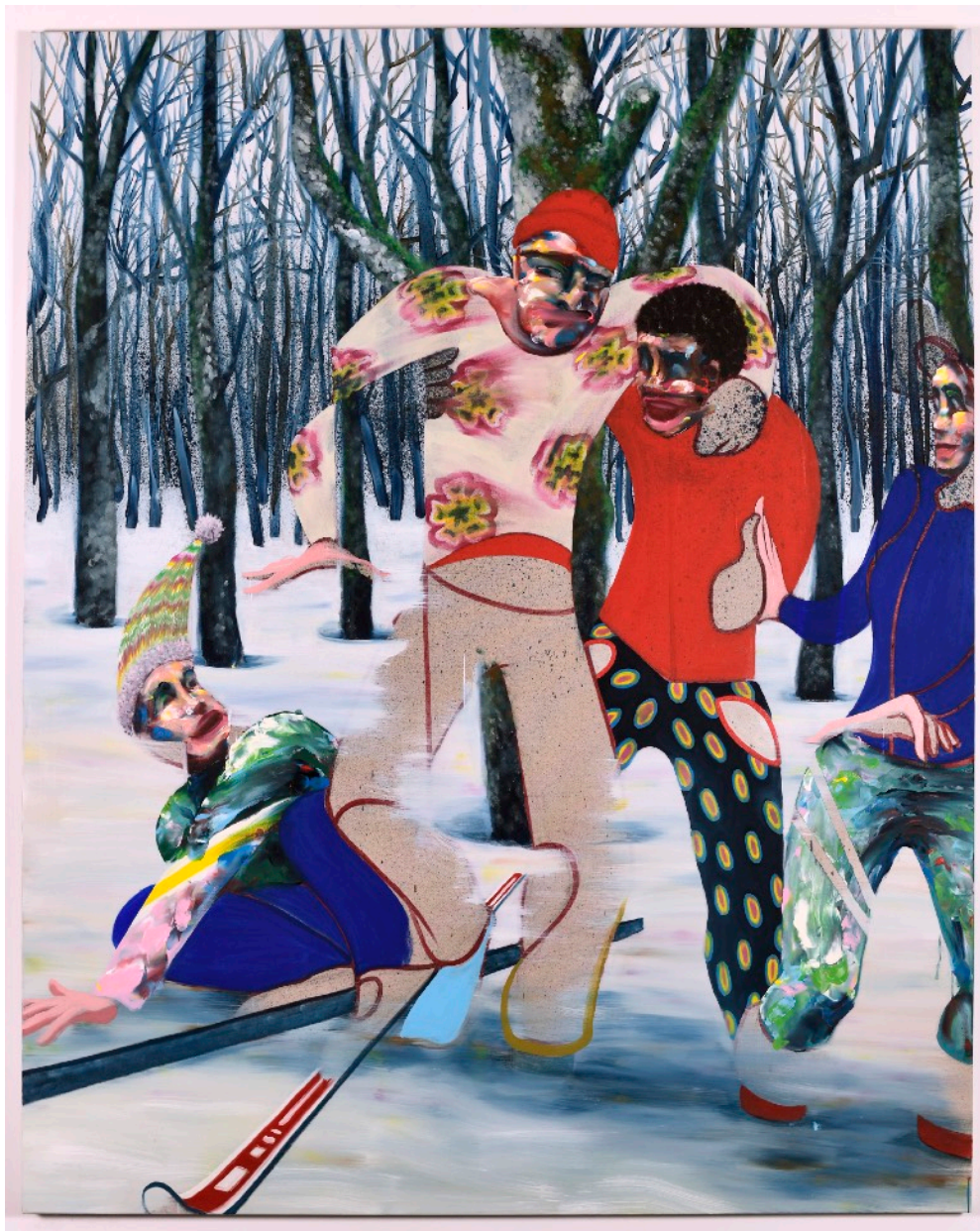
S'okay - 2019, huile sur toile, 200 x 160 cm

Né en 1976 à Lyon, vit et travaille à Paris