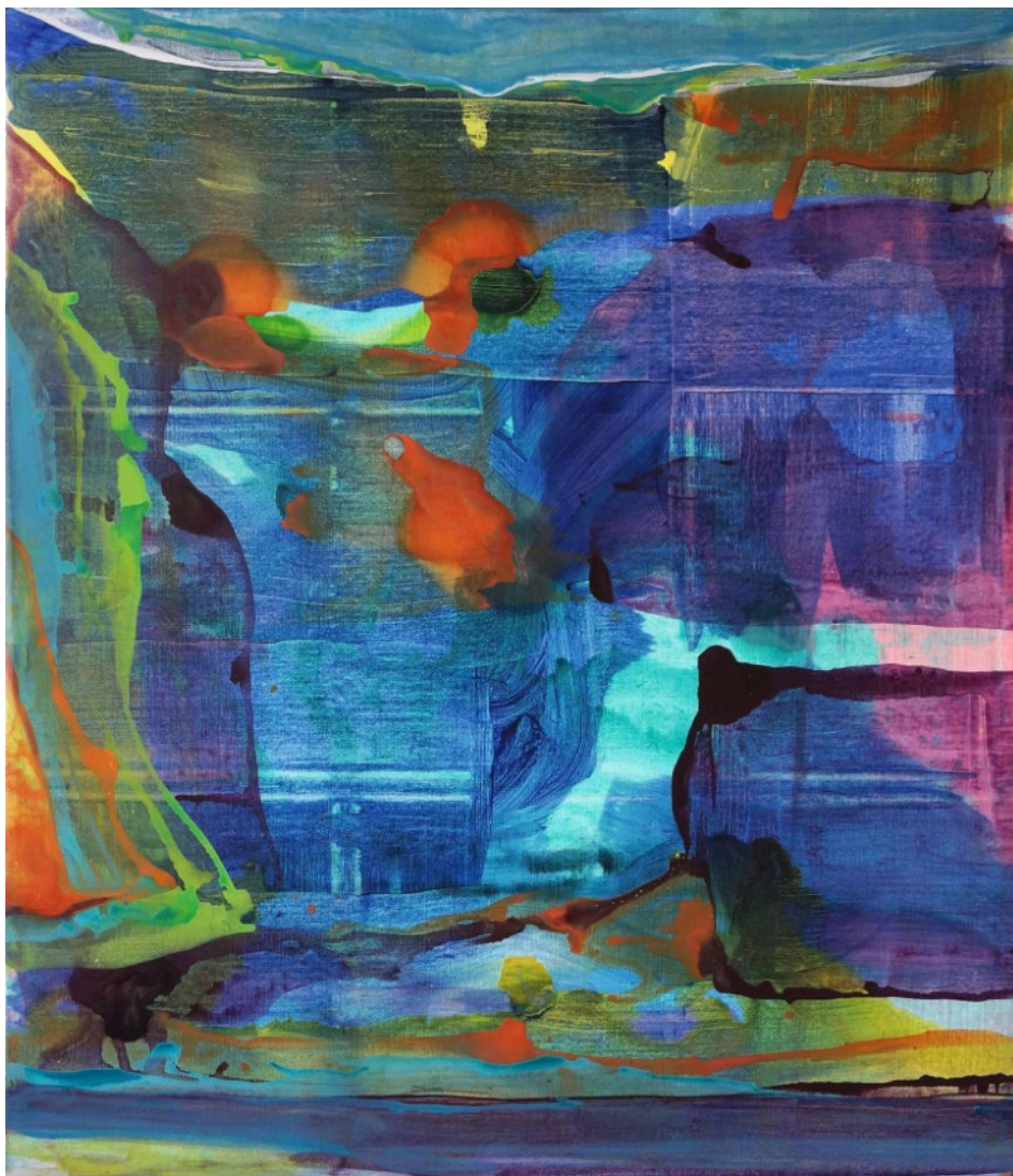
Blue matter - 2019, acrylique sur toile, 195 x 170 cm

Né en 1976 à Paris, vit et travaille à Paris